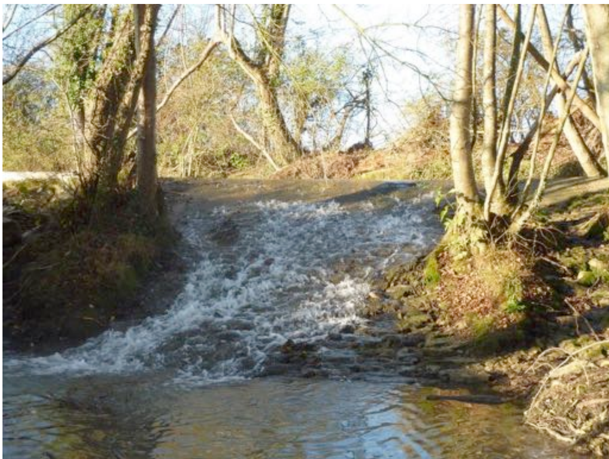
La cascade du ru de Buchin en automne.