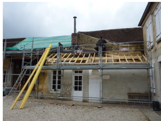
Première et deuxième étapes