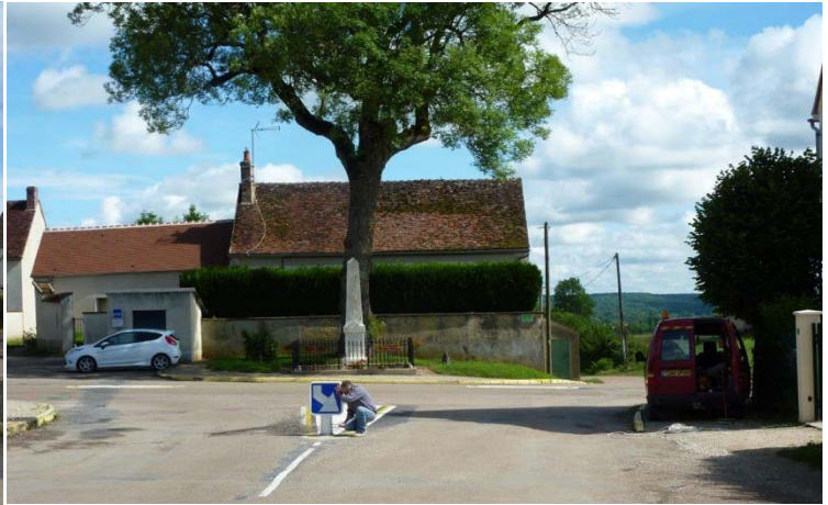
Disposition d'une flèche au carrefour Grand Rue-RD5